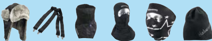
Bjørnøy side 26 Clip side 26 Neckcollar side 26 Maxi side 26 Midi side 26 Knit side 26