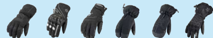
Tuxedo side 24 Papey side 24 Hamton side 24 Jox side 25 Wott side 25 Belcher side 25