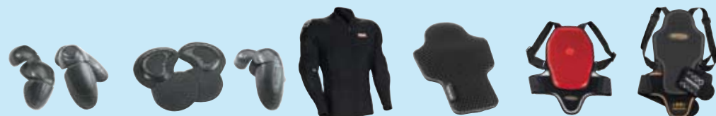
Protector Set Jacket side 20 Protector Set Pants side 20 Tribal side 20 Converter L2 side 21 Junior Back side 21 Track side 21