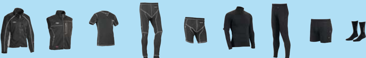
Comfort side 15 Coral side 15 Light Shirt side 22 Light Long side 22 Light Short side 22 Wintur side 23 Wolak side 23 Wojpa side 23 Sock side 23