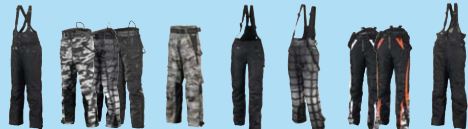
Scenic side 7 Halifax side 8 Cardinal side 10 Willow side 11 Osborn side 12 Lions side 17 Creek side 18