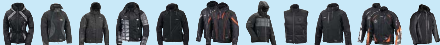
Ethel side 6 Kathryn side 7 Bosco side 9 Richmond side 9 Hoody side 10 Ewen side 11 Douglas side 12 Chris side 14 Frazer side 14 Royal side 16 Ajon side 18